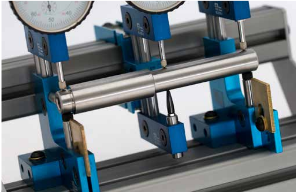
Vertikaler Pendelhalter zum Prüfen von mehreren Durchmessern