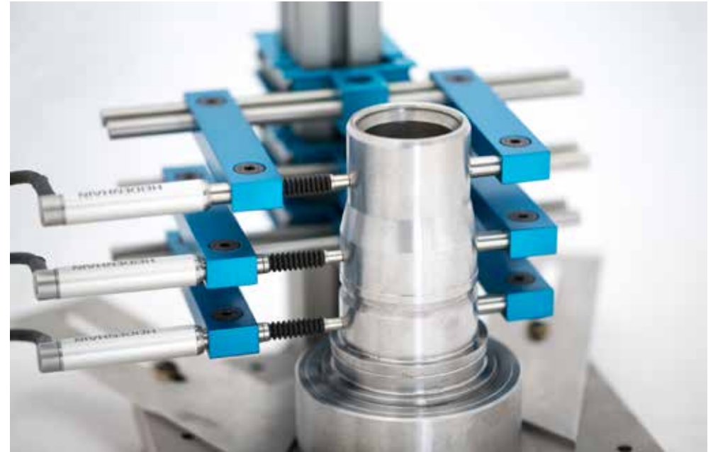
Horizontaler Pendelhalter zum Prüfen von mehreren und größeren Durchmessern